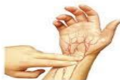
PULSACIONES DESDE LA MUÑECA

Una vez que encontró sus pulsaciones, existen también varias formas de determinar su cantidad en un minuto. Lógicamente la más exacta es contarlas durante 60 segundos pero en algunas situaciones es necesario contarlas de alguna forma más rápida para continuar con el ejercicio.