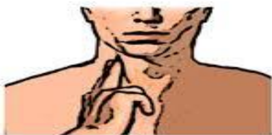
PULSACIONES DESDE EL CUELLO